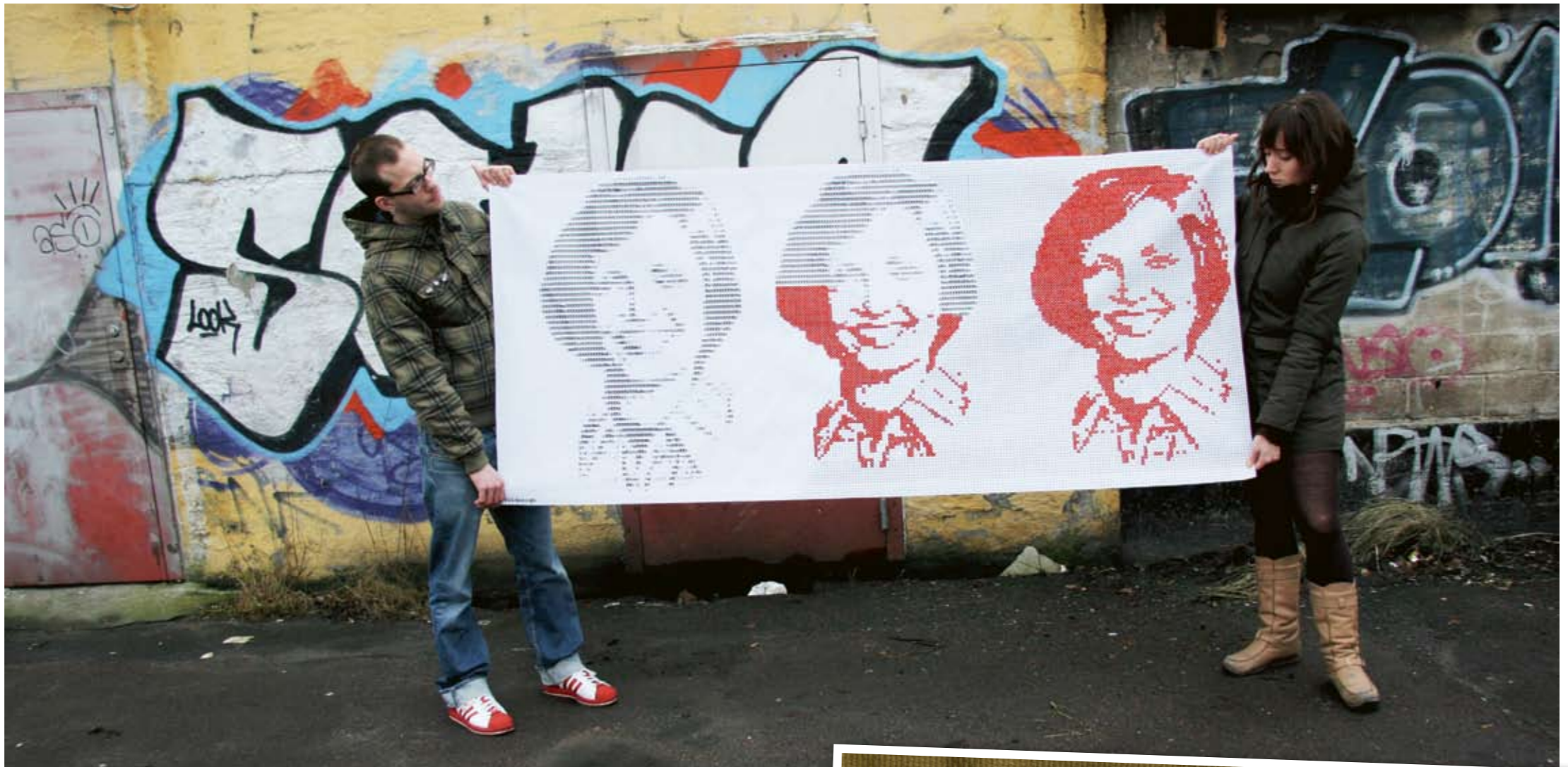
"Hemmafrubroderi". Designgruppen Fuldesign inspireras av tidigare generationers slöjdande men säger hellre pysslar än hemslöjdar eftersom det frigör från krav och regler.

– Vi bestämde oss för att inte dra några gränser. Vissa vill att det de gör ska kallas hemslöjd, andra säger hellre pyssel, en del gillar inget av orden. Vi skiljer inte mellan design, konstslöjd, pyssel, DIY ("do it yourself") och så vidare – då börjar man exkludera folk. ▶